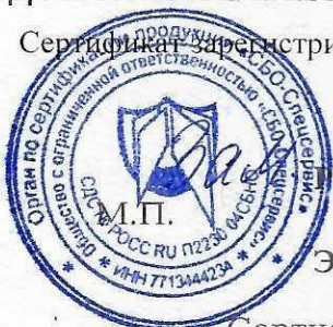
Схема сертификация 1с

Сертификат зарегистрирован на сайте СДС № РОСС RU.П2230.04СБН0 www.sboss.ru